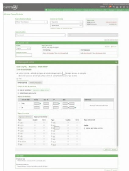
Regras de Controle

O sistema permite ainda que o usuário acompanhe seus dados pelo gráfico de Levey-Jennings de forma interativa, incluindo ações e comentários no decorrer da rotina e visualizando a aplicação das regras múltiplas.