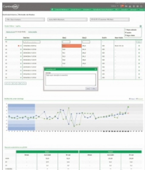
Monitoramento dos resultados